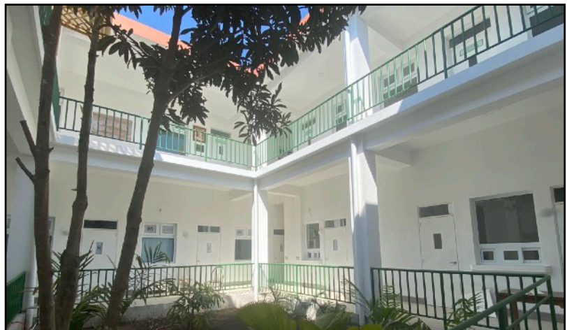
El nuevo anexo

La necesidad del banco de sangre es urgente. Afortunadamente, el Químico Biólogo comenzará a trabajar en HA en 2024 y ayudará con la adquisición del equipo de refrigeración necesario.