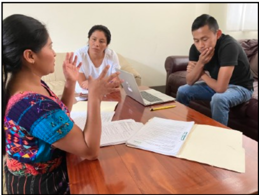
Directora de una escuela de auxiliar de enfermería, comparte su experiencia

Gracias a ustedes, nuestros donantes, la construcción de la nueva escuela de enfermería, cuatro clínicas, laboratorio y banco de sangre se completó en diciembre. La construcción comenzó el 1 de agosto de 2022 y se completó dentro del presupuesto y en el plazo previsto. Clave para la apertura de la escuela de enfermería fue el financiamiento de USAID y la Organización Internacional para las Migraciones (OIM), para completar el complicado proceso de solicitud. Todo estaba en marcha cuando la solicitud fue aceptada en mayo de 2023 y pasamos la inspección en agosto, con excelentes resultados. Sin embargo, el Ministerio de Salud actualiza sus requisitos cada cinco años, y después de que nuestra solicitud fue aceptada, se nos exigió presentar nuevos documentos. Como organización privada sin fines de lucro, no pudimos utilizar especialistas gubernamentales para el