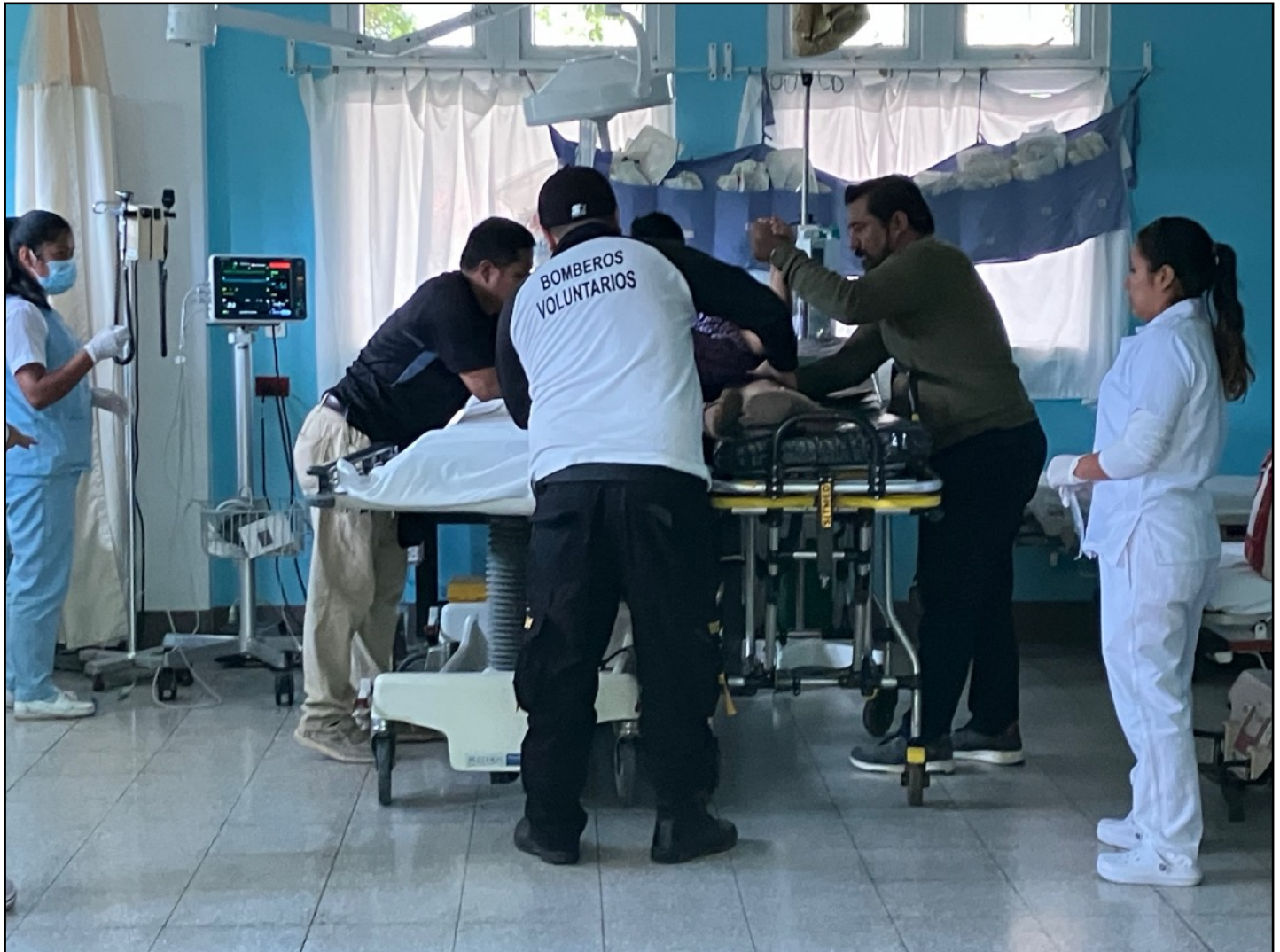
Personal de HA, rescatistas y familiares ayudan a un paciente en emergencia

El Hospitalito Atitlán ha formado un equipo de profesionales de la salud: 64 médicos, enfermeras, farmacéuticos, técnicos de laboratorio y anestesia, administradores y personal de apoyo. Gracias a su dedicación y arduo trabajo, el hospital puede brindar atención médica de calidad las 24 horas del día.