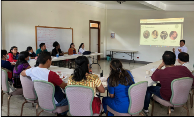
Personal recibe capacitación del Ministerio sobre tuberculosis