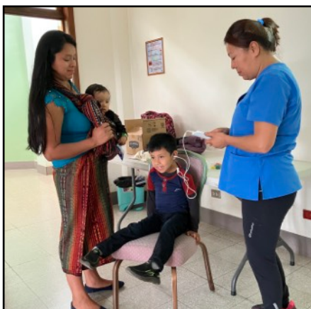
Exámenes de audición