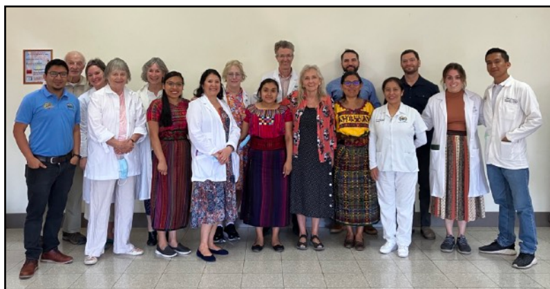
Pediatras y personal al inicio de la jornada