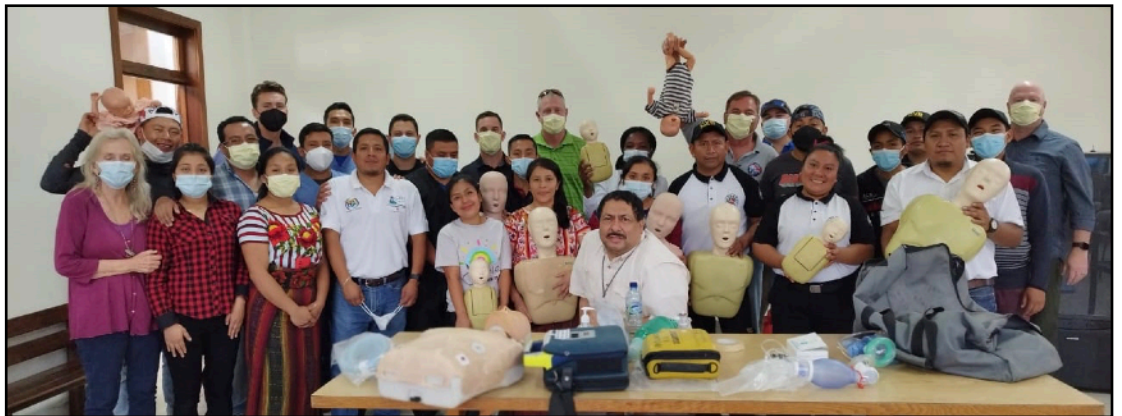
Los entrenamientos y simulaciones de RCP son parte de la educación continua

Bomberos y paramédicos de Tacoma, Washington, coordinaron dos capacitaciones en RCP para el personal del HA y trabajadores de rescate locales. La primera capacitación en enero y la segunda en marzo.