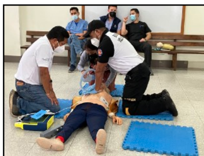
Entrenamiento en RCP