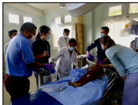
ATENCIÓN A EMERGENCIAS