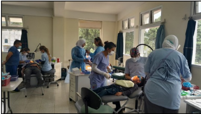
La odontopediatría es una especialidad no disponible en Guatemala

Varios equipos quirúrgicos regresaron fielmente a Santiago Atitlán cada año para brindar atención quirúrgica a pacientes que de otra manera no podrían haber resuelto sus problemas de salud. Los pacientes que pueden pagar, proporcionan una donación para cubrir el costo. Los que no tienen recursos económicos reciben cirugías gratuitas.