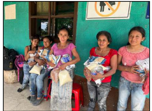
Donaciones para familias en Finca Metzabal

En el otoño de 2024, les pedimos su ayuda para comprar 'Kits de Recuperación Nutricional' para niños en la región afectada por el conflicto en Santa Catarina Ixtahuacán y ustedes respondieron, gracias. Debido al conflicto, trabajamos con el Ministerio de Salud para asegurarnos de que las familias con un niño desnutrido recibieran los kits. El 75% de los niños desnutridos que los recibieron lograron una recuperación completa durante los seis meses en que consumieron suplementos adicionales de leche, aceite, azúcar e Incaparina. La Fundación IZUMI en Boston MA apoya el programa nutricional de HA en todo el departamento de Sololá, pero los kits de recuperación son un extra, gracias.