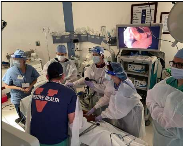
El equipo de Dr. Sauer durante un procedimiento

Varios equipos quirúrgicos regresaron fielmente a Santiago Atitlán cada año para brindar atención quirúrgica a pacientes que de otra manera no podrían haber resuelto sus problemas de salud. Los pacientes que pueden pagar, proporcionan una donación para cubrir el costo. Los que no tienen recursos económicos reciben cirugías gratuitas.