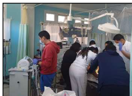
ATENCIÓN A EMERGENCIAS