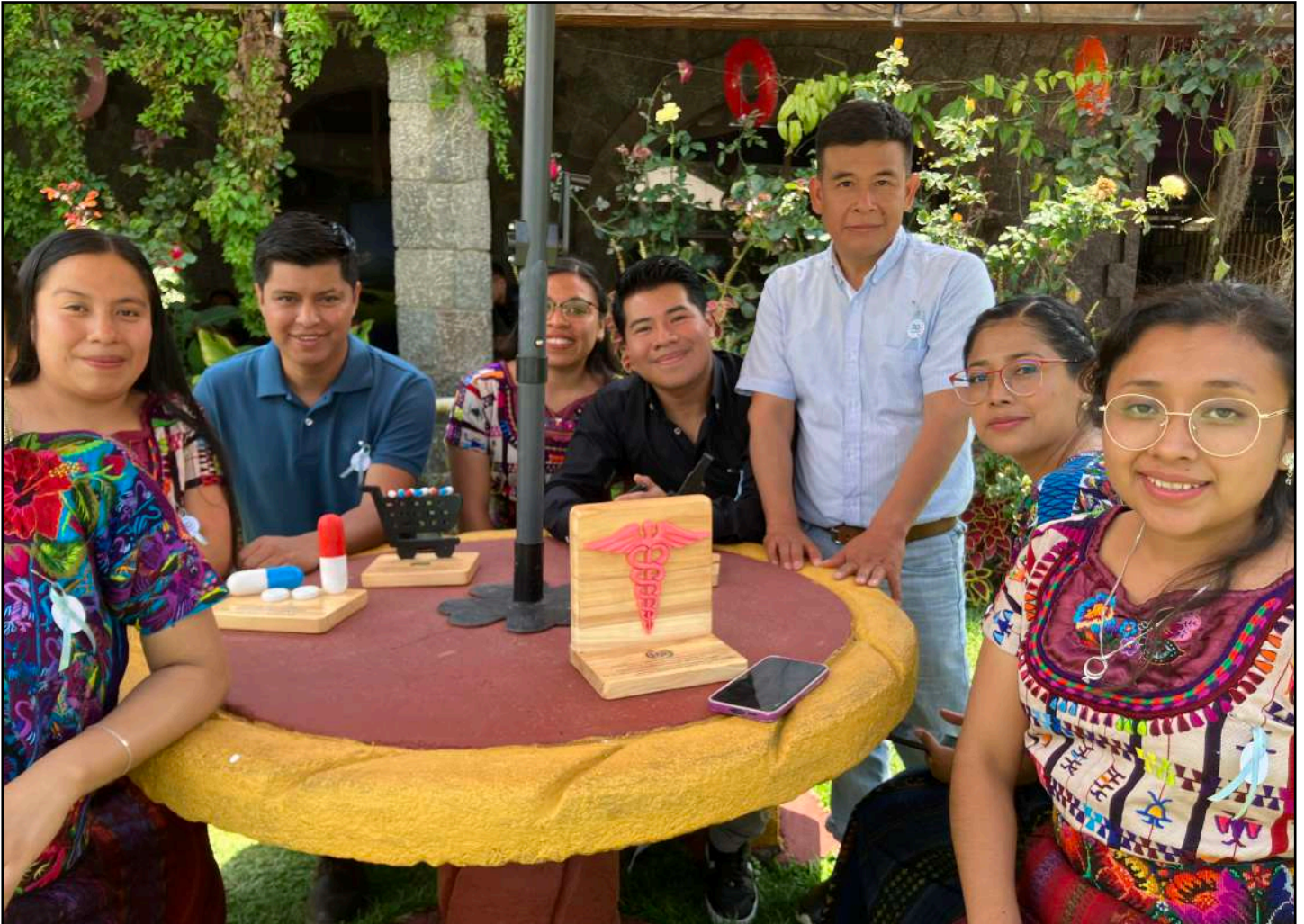
Personal de Hospitalito en la celebración del 20° aniversario en Abril

El Hospitalito Atitlán ha formado un equipo de profesionales de la salud: 80 médicos, enfermeras, farmacéuticos, técnicos de laboratorio y anestesia, administradores y personal de apoyo. Gracias a su dedicación y arduo trabajo, el hospital puede brindar atención médica las 24 horas del día.