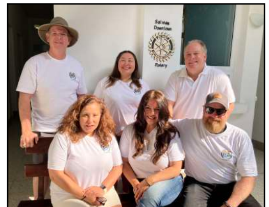
Los Rotarios de Salinas, California

La Directora de Desarrollo de HA se alegró de asociarse con los Rotarios del Centro de Salinas, quienes acordaron proporcionar una duplicación de fondos para la compra de equipo para el banco de sangre. A finales de agosto, gracias nuestra dedicada familia de donantes, se habían recaudado los fondos necesarios to comprar los aparatos. En diciembre, los Rotarios llegaron para la primera jornada de donación de sangre.