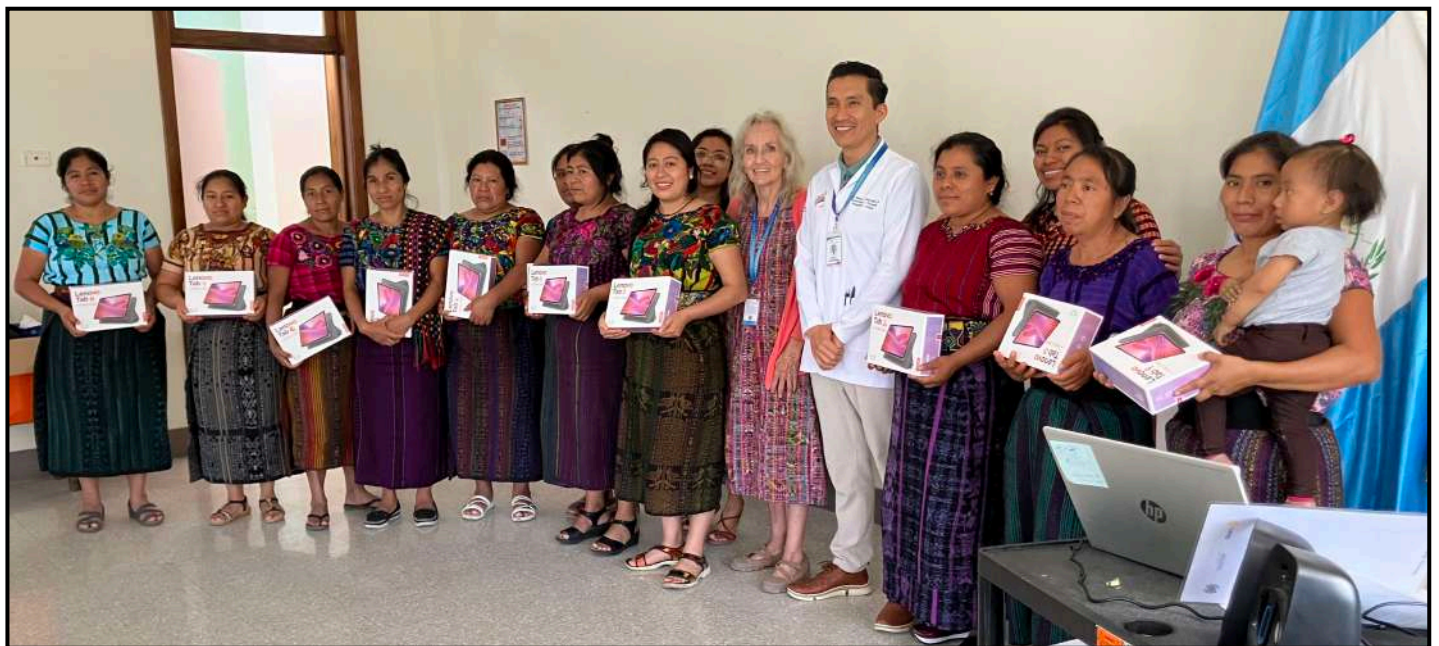
Las Promotoras de Salud recibieron capacitación sobre el uso de tabletas durante visitas domiciliarias

Misión: Hospitalito Atitlán es una institución sin fines de lucro que ofrece servicios médicos curativos y preventivos, accesibles para todos, con un enfoque en la salud materno infantil y con educación médica continua para profesionales de la salud nacionales e internacionales, con el fin de mejorar la calidad de vida en la región.