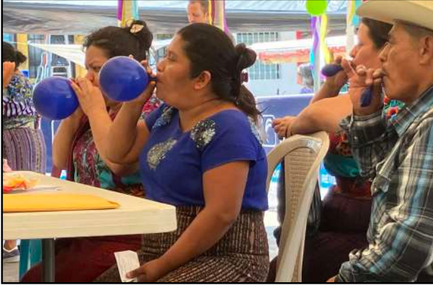
Comprobando la capacidad pulmonar en la feria