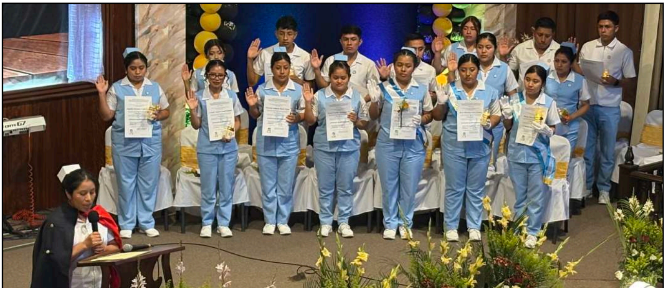
La graduación de la Escuela de Enfermería se llevó a cabo el 28 de noviembre.