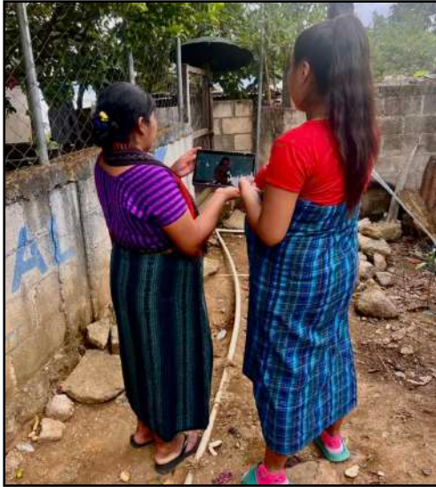
Visita domiciliaria de la promotora